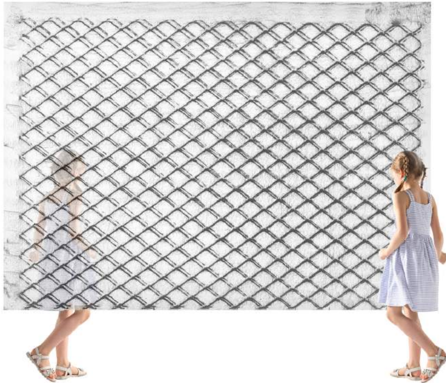
Armida Gandini – Ring-a-ring-o-roses - Digital print on photographic paper and glass - cm. 90 x 90 – 2016