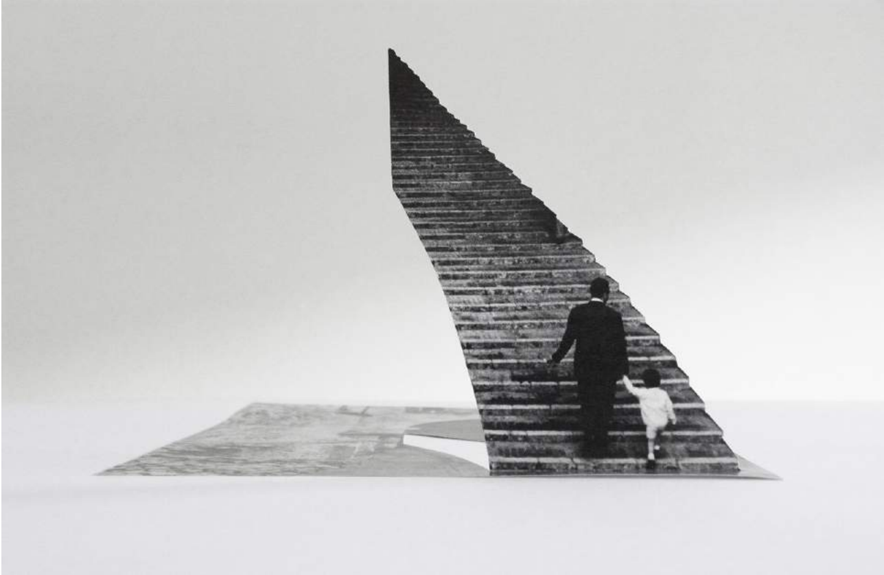
Armida Gandini - Stand Up – Cut out photography - 2016