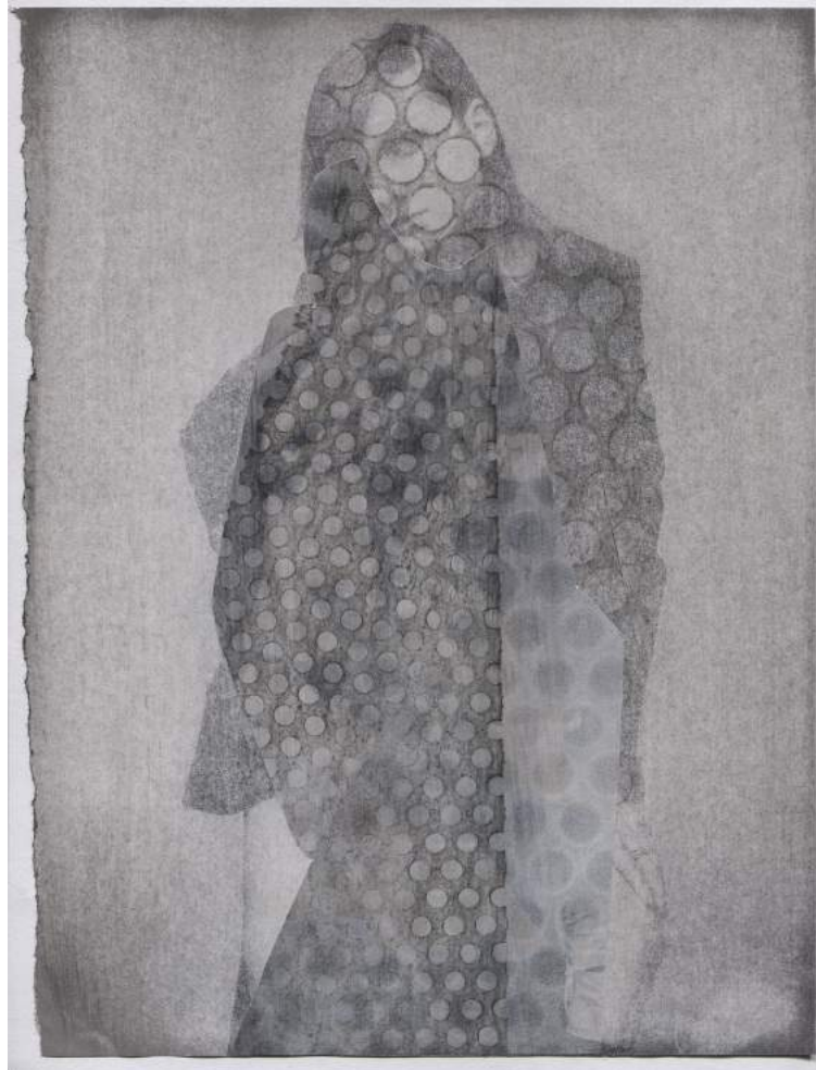
Armida Gandini - Casing #12 - Mixed technique on magazine paper - cm. 20 x 26,5 - 2016