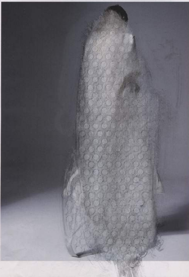
Armida Gandini - Casing #16 - Mixed technique on magazine paper - cm. 20 x 26,5 - 2016