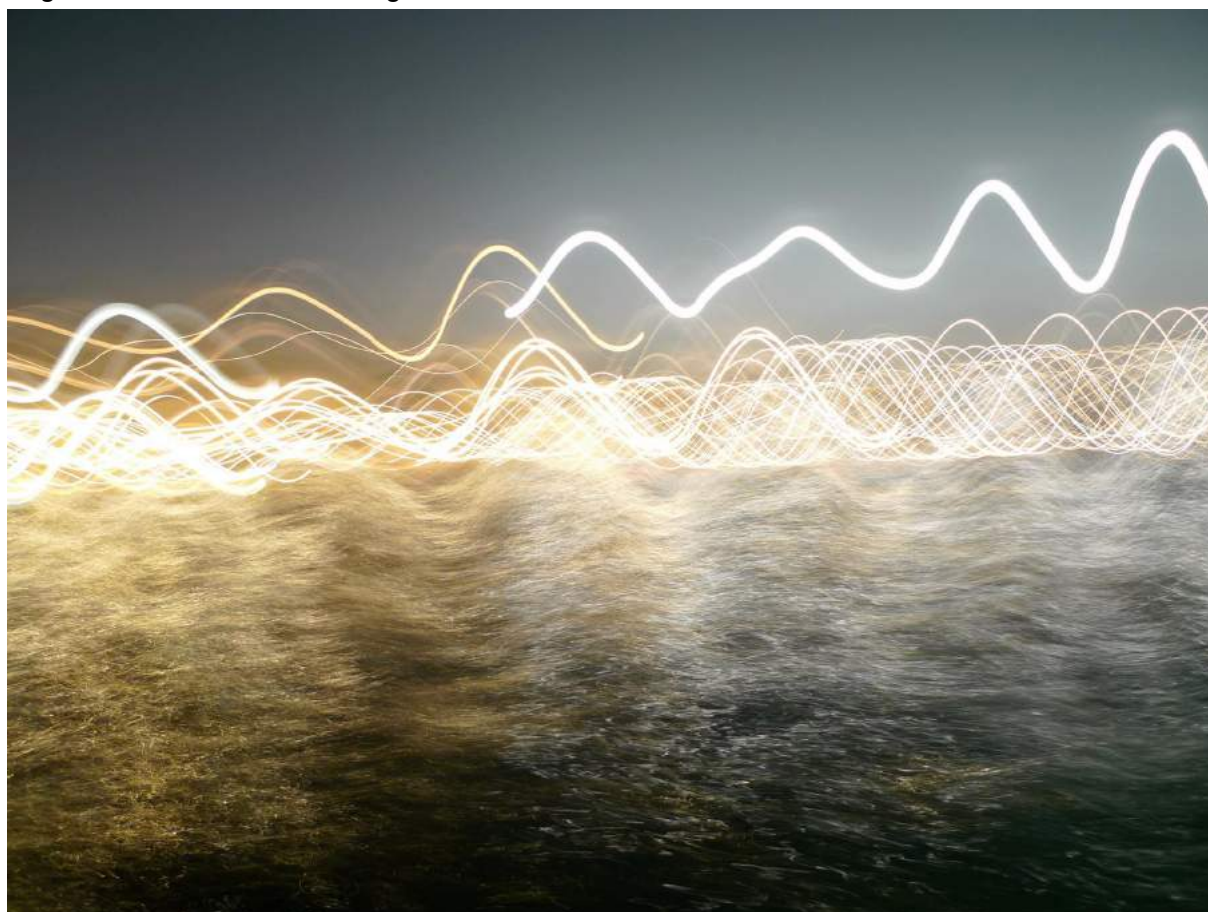
Francesco Caneloro – “The Times of the Light” - Venezia v 4, 2016 - Lambda print on photographic paper, ed. 1/7, cm. 50 x 37, 2018

Opmerking op afbeeldingen: neem contact met press@redstampartgallery.com om foto's of om hoge resolutie beelden te vragen