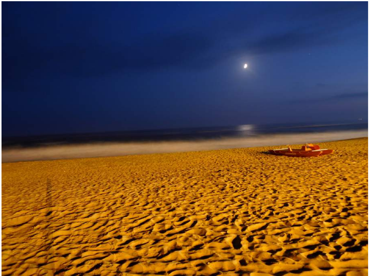
Francesco Candeloro – “The Times of the Light” - Ostia, 2011 - Lambda print on photographic paper, ed. 1/7, cm. 70 x 52, 2018