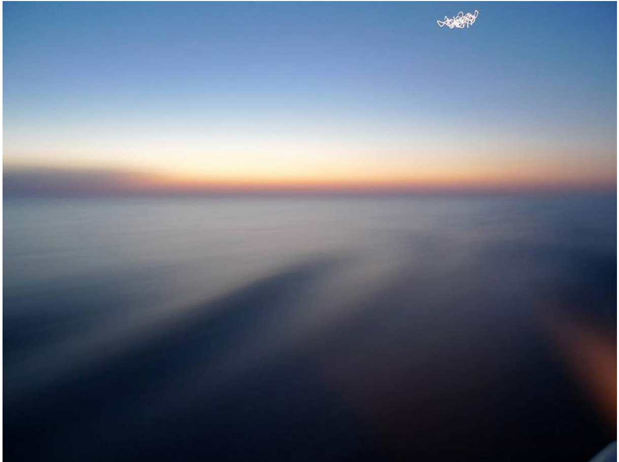
Francesco Candeloro – “The Times of the Light” - Lagosta, 2012 - Lambda print on photographic paper, ed. 1/7, cm. 70 x 52, 2018